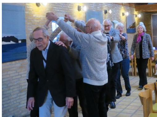
De Vaskeægte cowboys- og piger