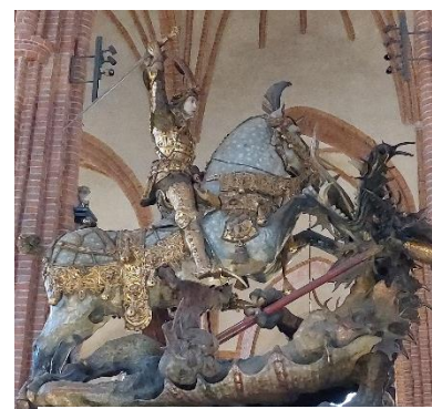
Sct. Georg og dragen i Storkyrkan i Stockholm.