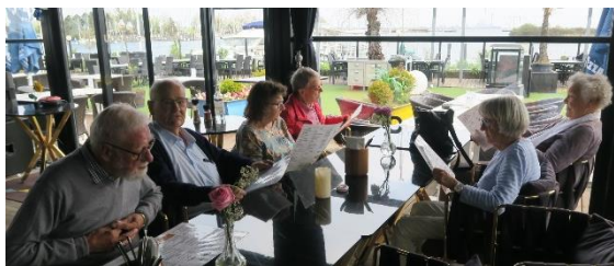
Hvad skal vi dog spise?? Arne er fotografen.