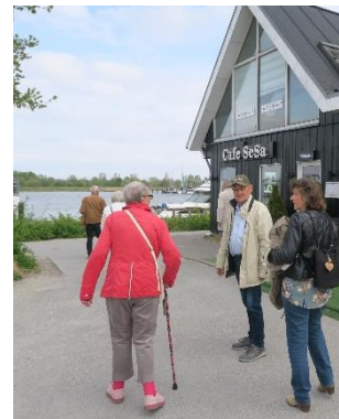
Vi ankommer til havn, vand og Cafe SeSa