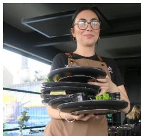
Den flinke servitrice har travlt

Hele gruppen undtagen Bodil, der var blevet forkølet – tog på udflugt til Cafe SeSa i Ishøj Havn. Vi snakkede og forsøgte at overdøve nabobordet, så godt vi kunne mens vi fik en udsøgt frokost, der varierede fra Stjernesked til Pariserbøf. Hertil serveredes diverse drikke med og uden alkohol – nogen skulle jo køre!