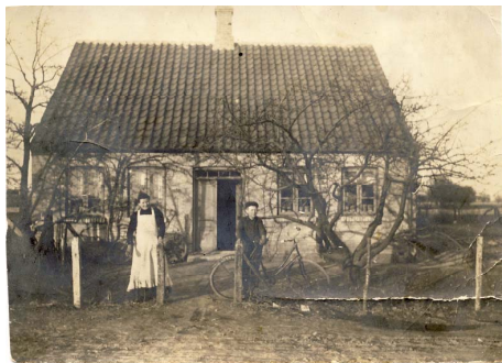
Bedsteforældres hus - Skomager

Far var uheldig på fabrikken og mistede et led på to fingre i en arbejdsulykke og forsikringen betalte erstatning på kr. 3000,-. Far købte så en nedlagt pigeskole med bindingsværk fra ca. 1780, som bestod af to huse, to WC'er og pissoir i gården. Baghuset lejede vi ud til uldgyder, omrejsende artister, fotografer og lignende. Et værelse koste fem kroner om ugen; men så var der også varmt vand til barbering, varme fra kakkelovn og af og til lavede mor kaffe til dem. Der var også et lille kammer, der kun kostede 2,50 krone pr. uge.