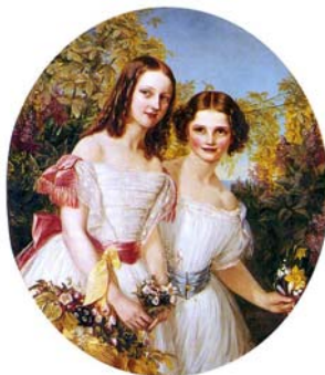
Prinsesse Alexandra og Dagmar af Danmark

Hun blev født i Det Gule Palæ 26. nov. 1847 og var det 4. barn ud af 6.