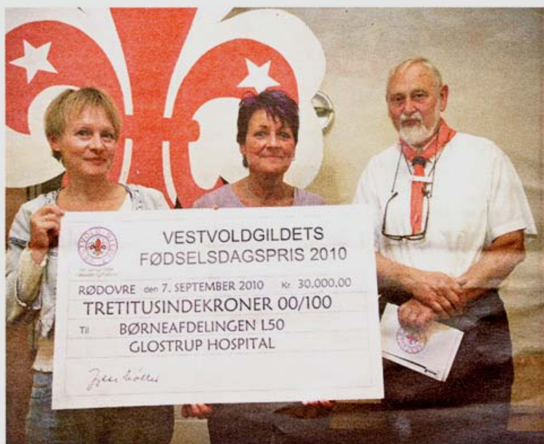
FØDSELSDAGSGAVE: Som altid når gildebrødrene fejrer fødselsdag, er det børn og unge som får gaverne. Forleden fik repræsentanter fra børneafdelingen på Glostrup Hospital penge til at købe nye fjernsyn og Wii-spil til de unge patienter.