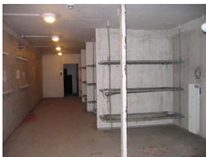
Køjer til artilleribesætning