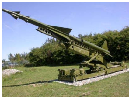
Nike Ajax, Hercules' forgænger.