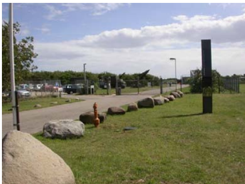
Indgangen til koldkrigsmuseet Stevnsfortet